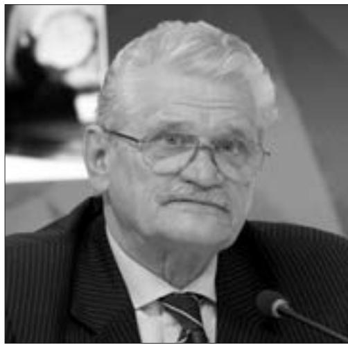
Vladimir Sajin, rusiyalı politoloq, iranşünas

"Türkiyə İranın bütün Yaxın Şərq regionunda ənənəvi rəqibidir. Türkiyə ciddi bir gücdür, NATO üzvüdür, Şimali Atlantika İttifaqında ABŞ -dan sonra ikinci ən güclü ordusu olan bir dövlətdir. Bu səbədən Tehran birbaşa Türkiyəni günahlandırmaqdan qorxur. Və bütün ittihamları Azərbaycana qarşı yönəltməklə, Azərbaycan üzərindən Türkiyəyə mesaj göndərmək daha asandır. Bundan başqa, İranla Türkiyə arasında Tehranın da korlamaq istəmədiyi iqtisadi əlaqələr var.