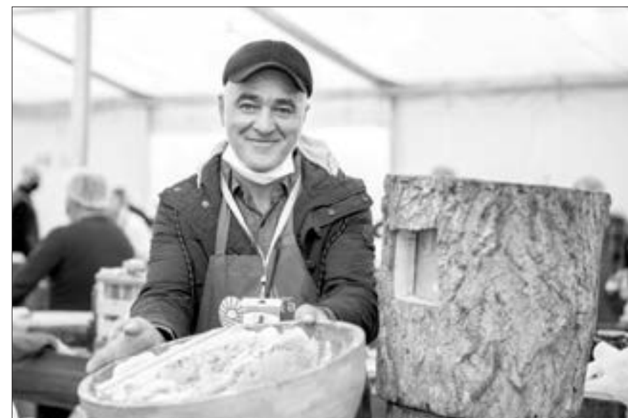
Bakıda bal yarmarkası...