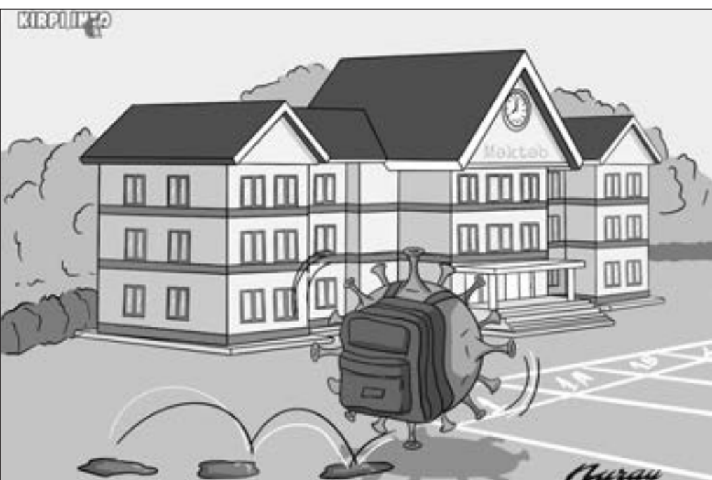
Azərbaycanda 12-15 yaşlı yeniyetmələrə vaksin vurulacaq...