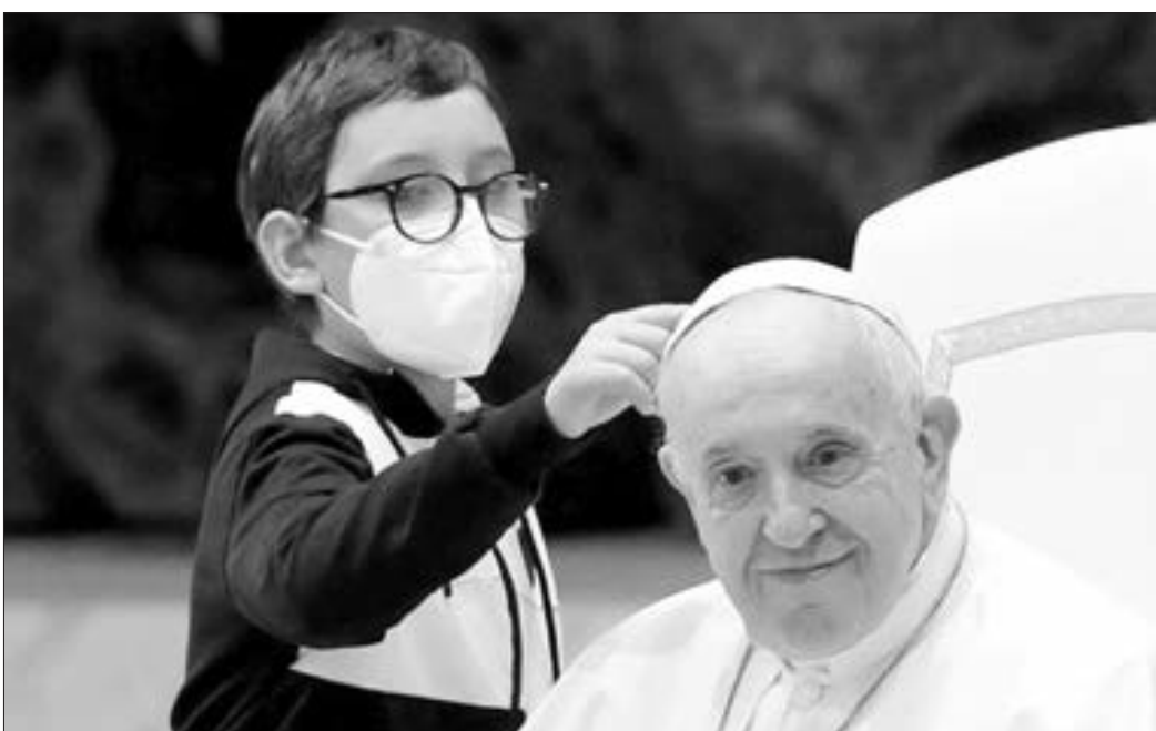
Roma Papasının həftəlik görüşündən maraqlı görüntü...