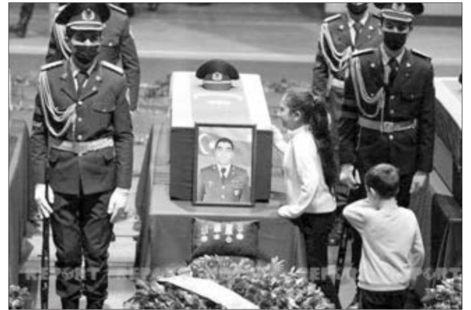
Şəhidlərlə vida mərasimi...