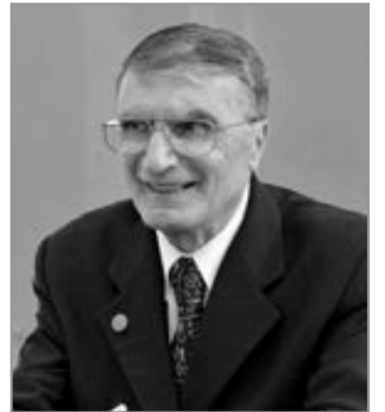
Aziz Sancar, Nobel mükafatı laureatı

" Türk dünyasında bir türk şüuru oyanıb, yaxşı şeylər olur. Bunu Azərbaycanda və Özbəkistanda da gördüm "