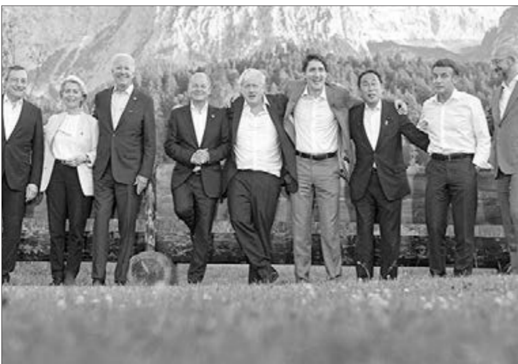
"G7" liderlərinin sammitindən

66 Tələbə adı qazananlar təhsil kreditindən necə yararlanacaq Xalid Kərimli, iqtisadçı ekspert Ödənişlərlə bağlı Təhsil Nazirliyi də tələbələrə bir qədər möhlət verə bilər. ▶ Səf. 7