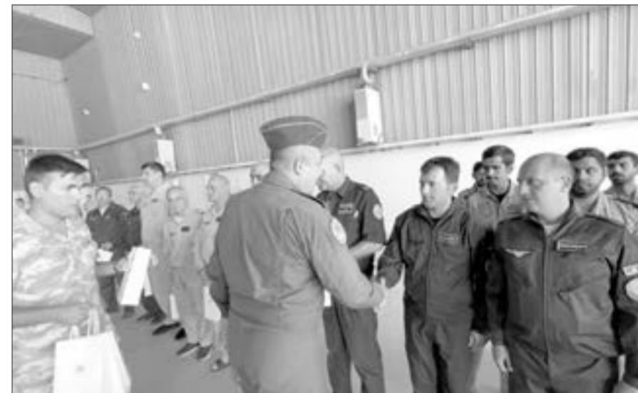
Türkiyəli general azərbaycanlı yanğınsöndürənlərə hədiyyələr təqdim etdi