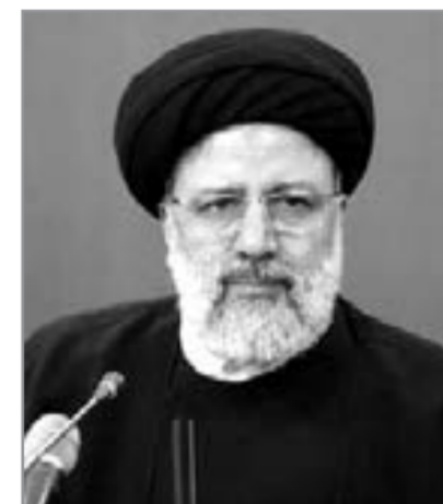
Seyid İbrahim Rəisi, İran Prezidenti

Hesab edirəm ki, biz münasibətlərimizdə olan bir çox potensialdan tam istifadə edə bilməmişik