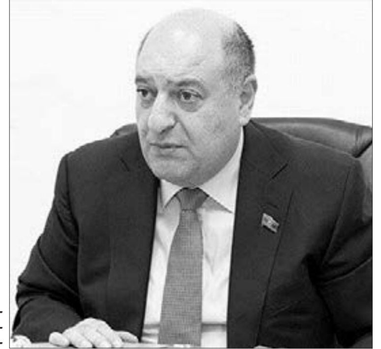
Musa Quliyev, Milli Məclisin Əmək və sosial siyasət komitəsinin sədri

den olan insanlara qayğısının, diqqətinin nümunəsi olaraq bütün Azərbaycan cəmiyyətinə bir mesajdır ki, həmin insanlar bizim torpaqlarımızın işğaldan azad olunmasında, Vətənimizin qorunmasında, ərazi bütövlüyünün təmin olunmasında həyatlarını, sağlamlıqlarını itiriblər, xəsarət alıblar. Və cəmiyyətin hər bir üzvü də bu insanlara yüksək qayğı göstərməlidir. Yəqin ki, bu proses davam edəcək və bundan sonrakı dövrlərdə də həmin insanların istər pensiyalarının, müavinət, təqaüdlərinin artırılması, istər mənzil-məişət şəraitinin yaxşılaşdırılması, istərsə də iş yerləri ilə təmin olunması istiqamətində dövlətin siyasəti davam edəcəkdir.