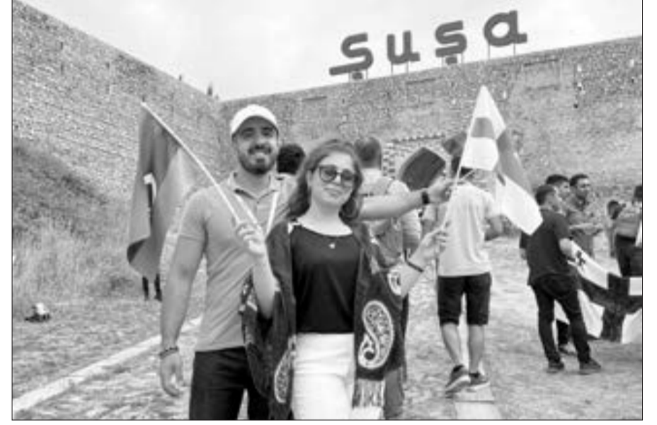
30 il sonra Şuşada ilk evlilik təklifi