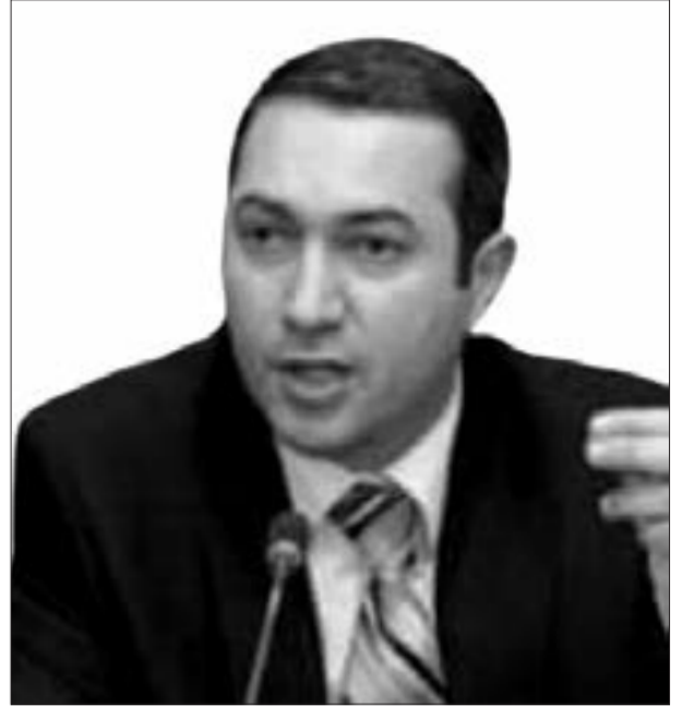
Rövşən Hüseynov, Azərbaycan Xalq Sosialist Partiyasının sədri

- Ukrayna-Rusiya müharibəsi kifayət qədər uzandı. "Ukrayna hücumu keçib, üstünlüyü ələ alıb", yaxud "Rusiya məğlub olarsa, nə baş verə bilər?", "Qalib olarsa, nə baş verər?" tipli suallar ətrafında