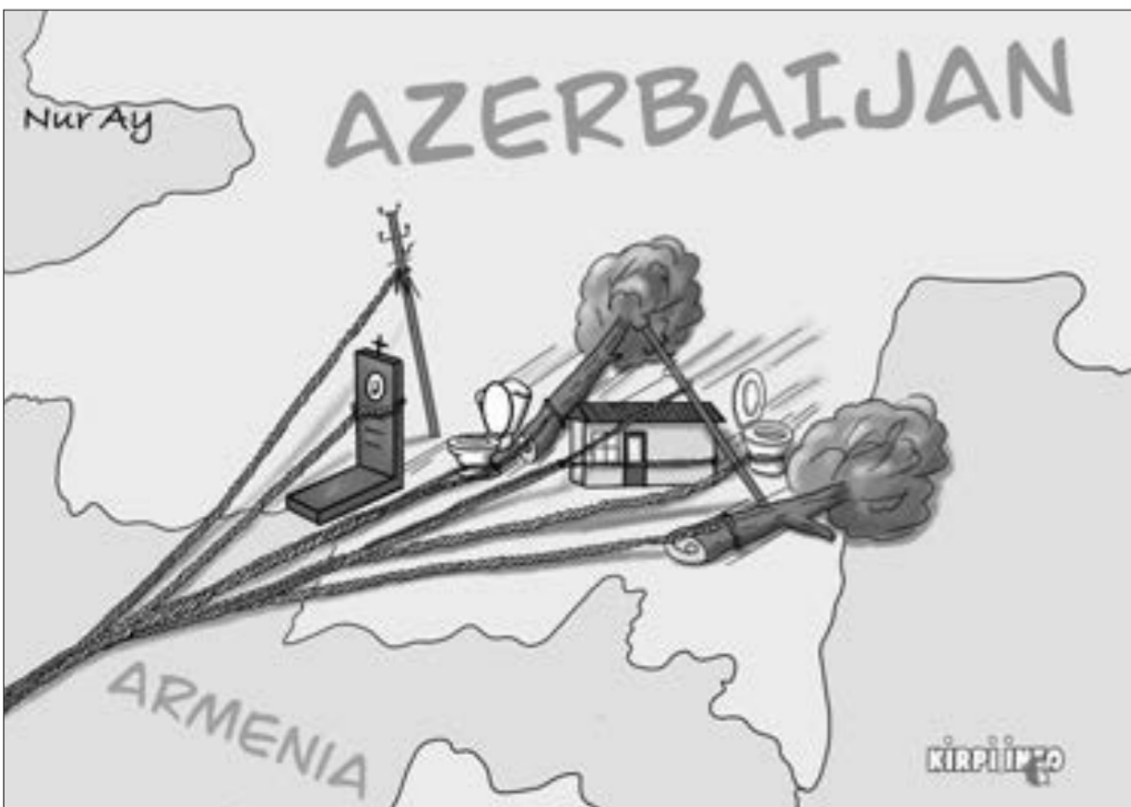
Torpaqdan başqa hər şeyi aparmağa çalışanlar

“ Rusiya Donbasda soydaşlarının müdafiəsinə qalxdı”