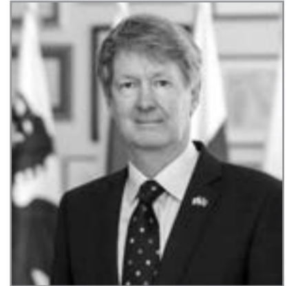
Ceyms Şarp, Böyük Britaniyanın Azərbaycandakı səfiri

“ Britaniya Qarabağda minaların təmizlənməsi ilə bağlı Azərbaycanla əməkdaşlığı genişləndirəcək