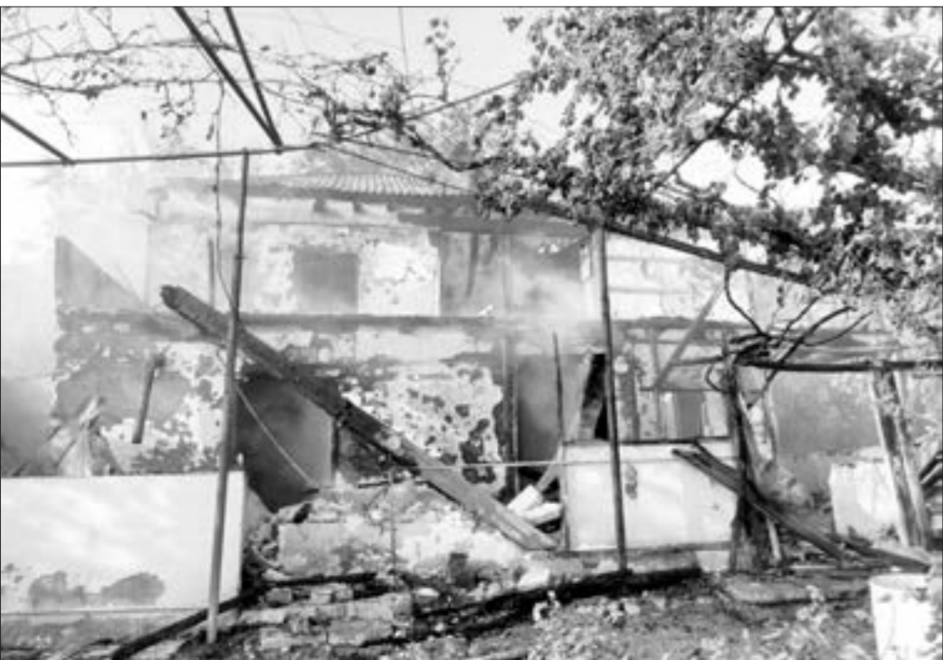
Şabrandakı yangında 13 ev yandı