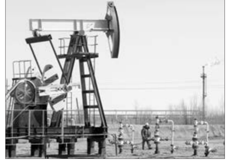
Neft bazarını nə gözləyir?

Məlum olduğu kimi, "G-7" ölkələri, Avstriya və Avropa İttifaqı Rusiya neftinə qiymət tavanı barədə birgə qərar qəbul ediblər. Dekabrın 5-dən etibarən həm qiymət tavanı, həm də Avropa İttifaqının Rusiyadan neft almasının qadağan olunmasını nəzərdə tutan qərarı qüvvəyə minib. Qeyd edək ki, Rusiya neftinə qiymət tavanı olaraq 1 barel üçün 60 dollar müəyyənləşdirilib.