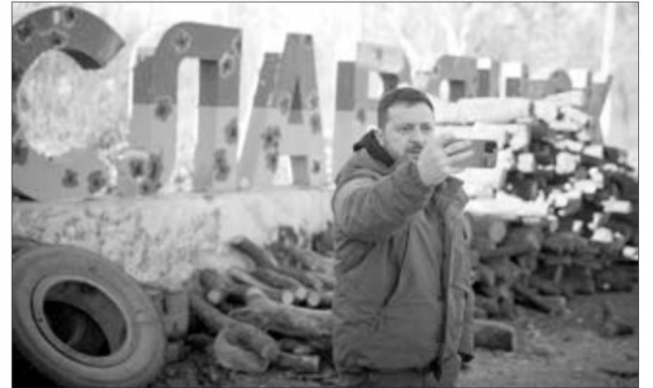
Zelenski Ukrayna ordusunu Donetskədən təbrik etdi