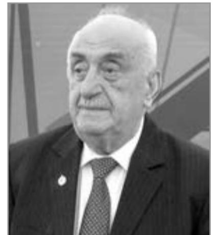
Xoşbəxt Yusifzadə, akademik