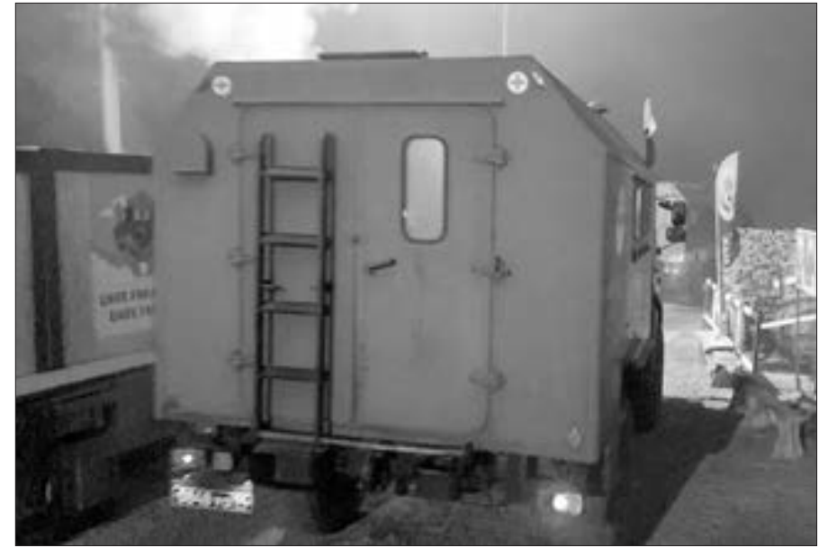
Gün ərzində Laçın yolundan 61 avtomobil keçib