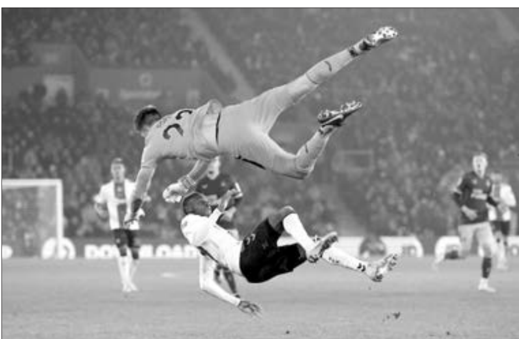
İngiltərə futbol çempionatının son turunda yaşanan maraqlı an