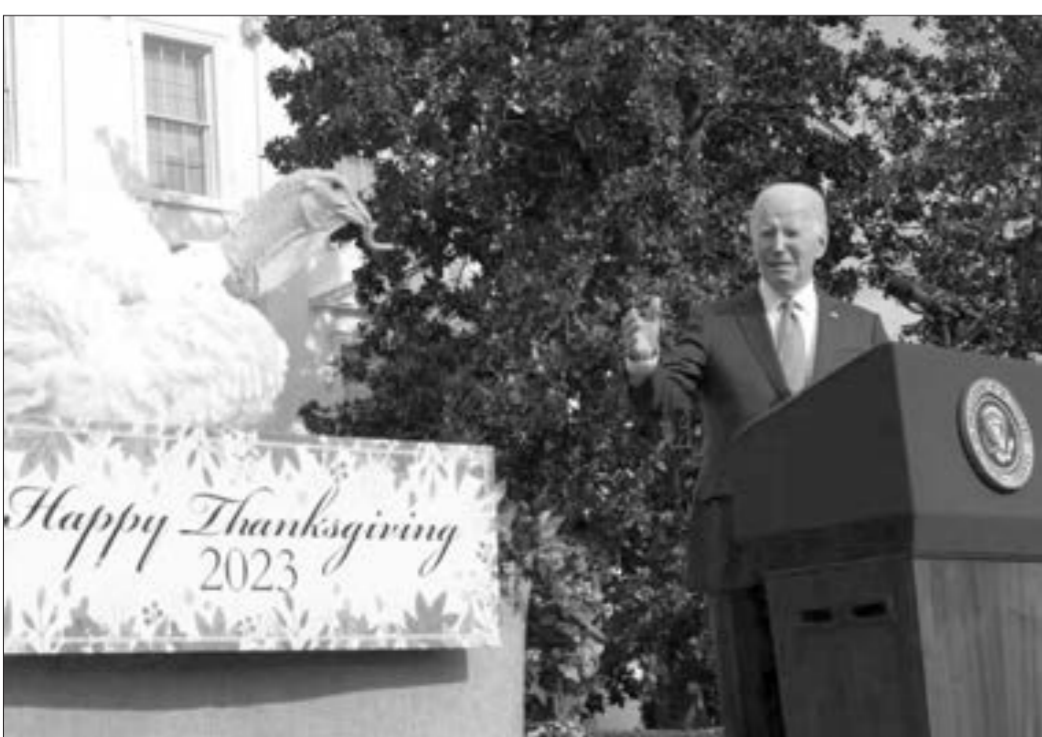
Bayden Şükranlıq Günü münasibətilə hind quşunu əfv etdi