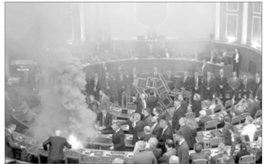
Albaniya parlamentində müxalif deputat tüstü bombası atdı