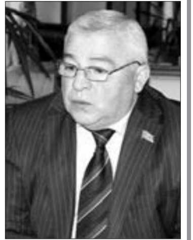
Elman Məmmədov, Milli Məclisin deputatı

20 noyabr tarixində Azərbaycan dövləti və xalqı "Ağdam Şəhər Günü"nü böyük fəxr hissi ilə qeyd etdi. Erməni separatçı qüvvələri 2020-ci ildə işğal dövründə viran qoyduğu Ağdam şəhərini bir güllə atmadan azad etməyə məcbur edildi. İndi Ağdam bərpa edilir. "Həftə içi"-nə müsahibə verən Şuşa-Ağdam-Xocalı seçki dairəsinin deputatı Elman Məmmədovla söhbətimiz maraqlı alındı: