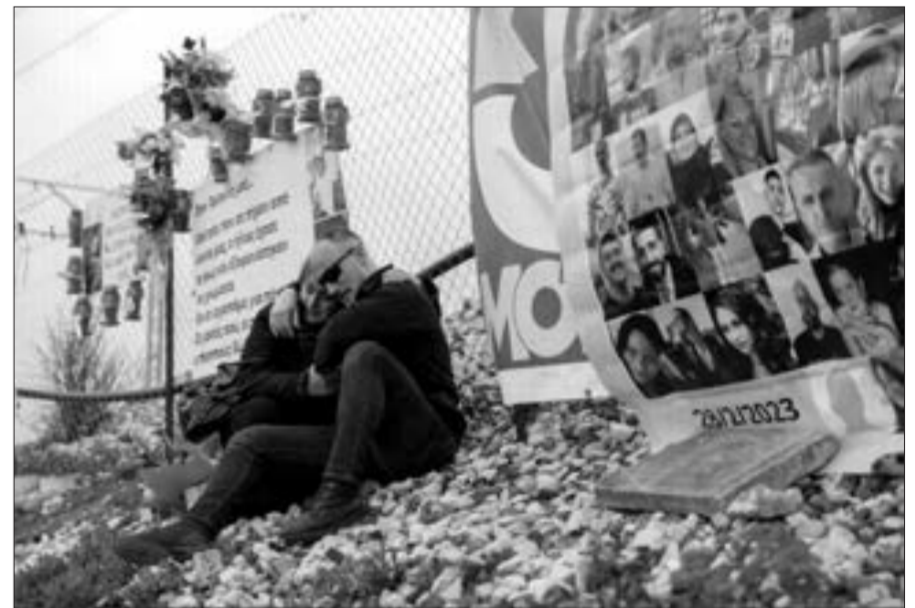
Yunanistanın ən ölümcül qatar qəzasının ildönümü