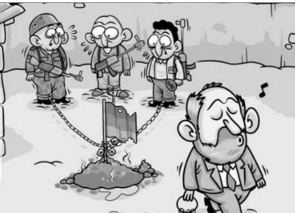
Ermənistanın yeni ordu quruculuğu prosesi