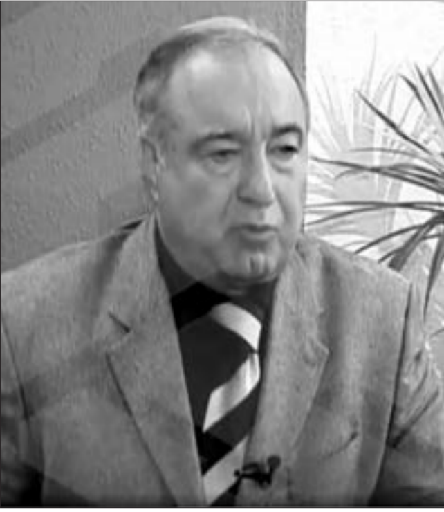
Taccəddin Mehdiyev, Azərbaycanın sabiq müdafiə naziri, general-mayor