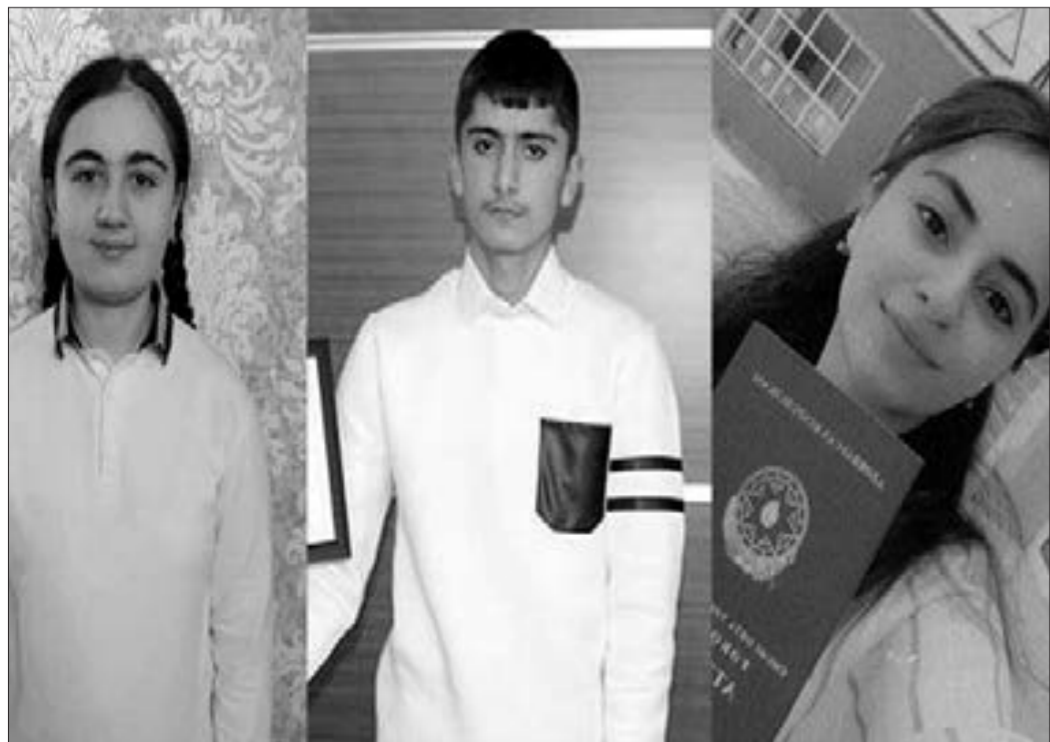
Buraxılış imtahanında yüksək bal toplayanlar