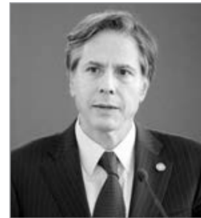
Antoni Blinken, ABŞ dövlət katibi

“ ABŞ müxtəlif sahələrdə Azərbaycanla əməkdaşlığı genişləndirmək niyyətindədir ”