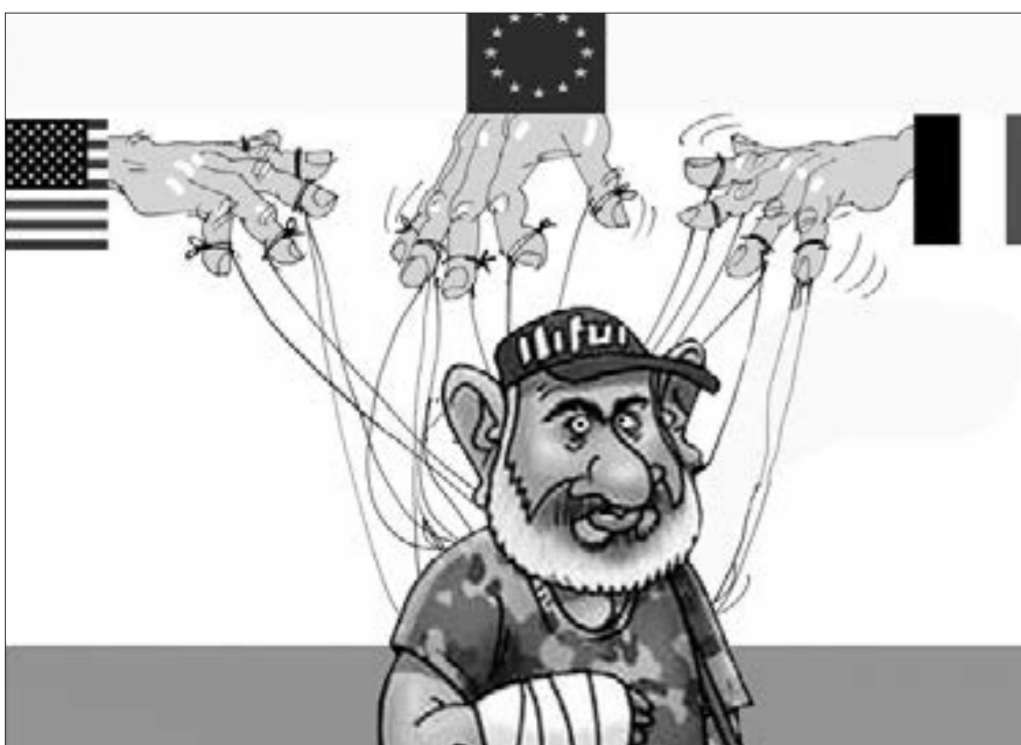
Bilirdim belə olacaq

“ Ölkəmizdə əhalinin neçə faizi kirayədə yaşayır? ”