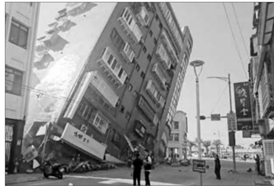
Tayvanda 7,5 bal gücündə zəlzələ baş verdi